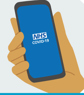
NHS COVID-19 অ্যাপ

এই অ্যাপ একজন ব্যবহারকারীর সমস্ত গোপনীয়তা বজায় রেখেই এই সব কাজগুলি করে। একজন নির্দিষ্ট ব্যবহারকারী কে বা তিনি কোথায় আছেন তা, সরকার-সহ, অন্য কেউ-ই জানবে না।